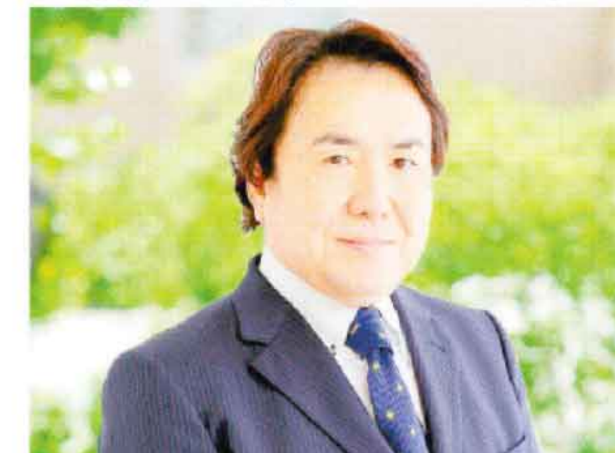
結婚相談所フェアレン ☎028-612-8935 宇都宮市西川田3-8-17-2004

あなたのお子さんも幸せな結婚へ! 宇都宮で開業し早10年、500組を超える お世話実績のお仲間会社になりました。 出会いがない、婚活に消極的、話しづら いお子様をその気にさせましょう。