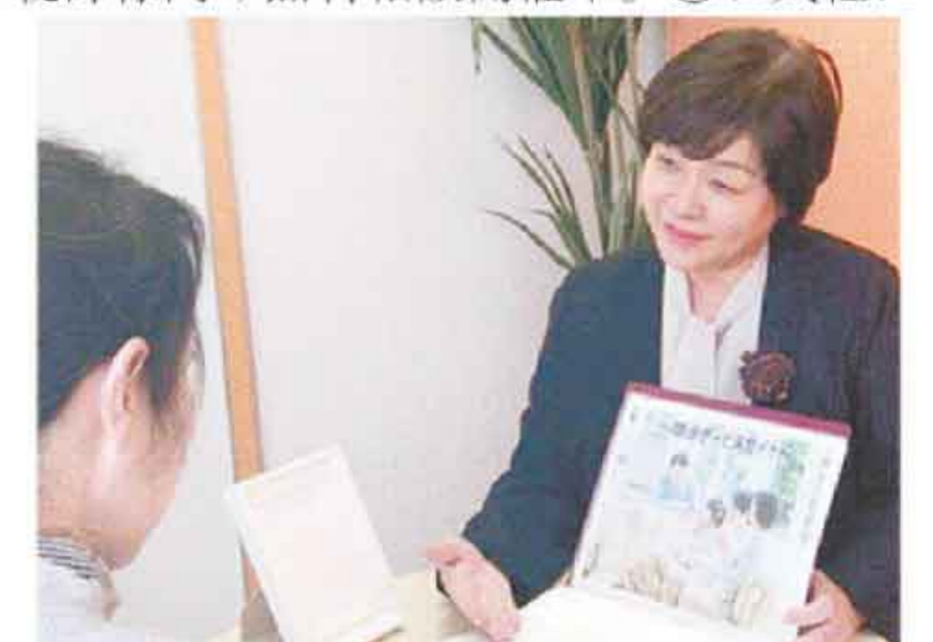
結婚相談所ムスベル宇都宮店 宇都宮市 東宿郷4-2-7-7F ☎0120-802-031

◇お子様の結婚相談◇ 「うちの子も結婚できました!」とお喜 びの声多数。多くの成婚実績を持つムス ベルが、お子様の婚活を全面サポート! 親御様向け無料相談開催中。◎お気軽に