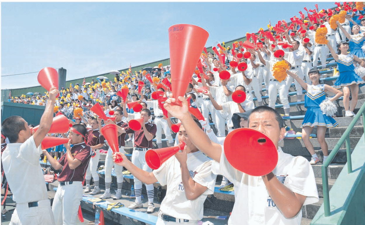
チームのチャンスに声援を送る国学栃木の応援団