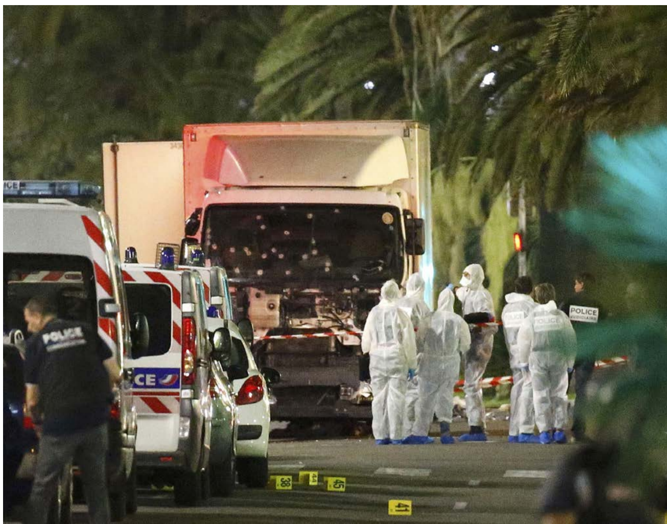
15日、フランス・ニースで群衆に突っ込んだトラックと、そばに立つ警察官や鑑識担当者